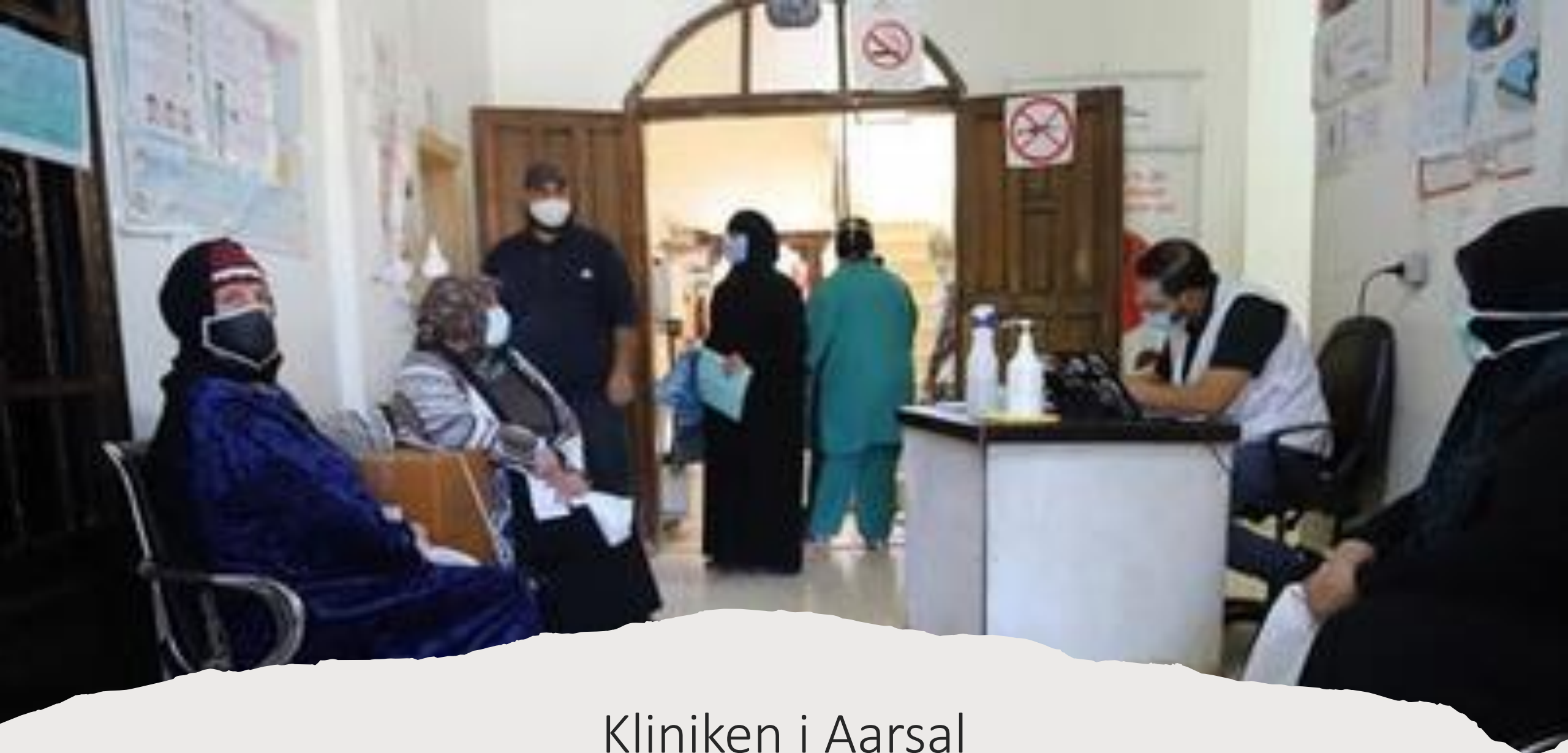
Kliniken i Aarsal